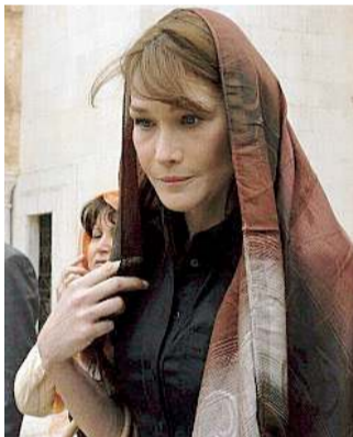
Carla Bruni col velo islamico

La polemica "Prostituta". Sarkozy: insulti inaccettabili Sakineh, l'Iran a Carla Bruni "Devi morire"